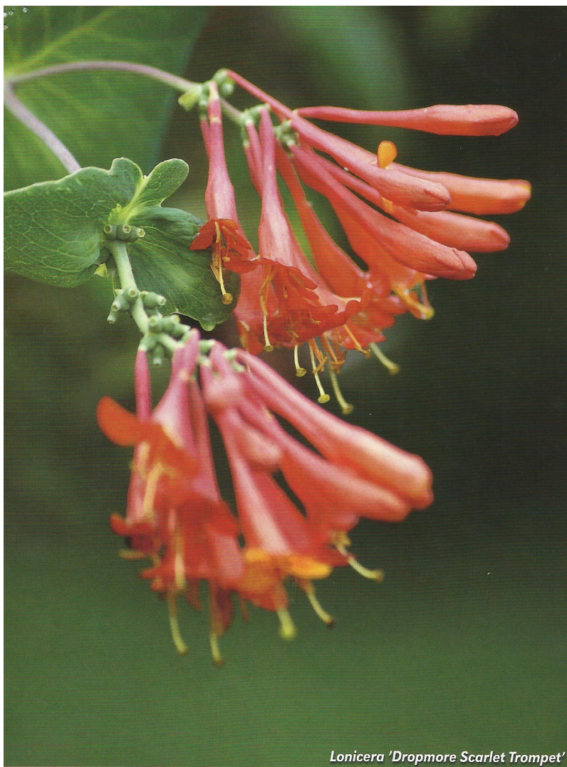
Lonicera 'Dropmore Scarlet Trumpet'